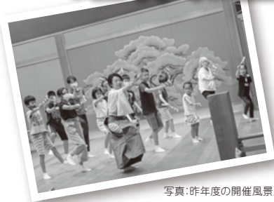
写真：昨年度の開催風景