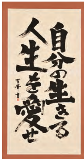
コミュゼ川崎大賞 書作品 《自分の生きる人生を愛せ》 谷口 百華