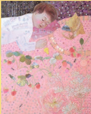
◀ 第55回 かわさき市美術展 最優秀賞《ドロップが降る夜の夢》菊地 彩香