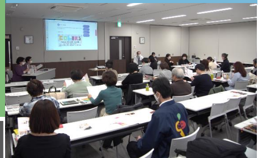
▲昨年の様子 活発な意見交換で様々な交流が芽生えました

関心のある分野や活動内容等について、参加者の皆さんに簡単な自己紹介をしていただき、ゲストアドバイザーの皆さんも交えて、今後につながる意見交換を行います。