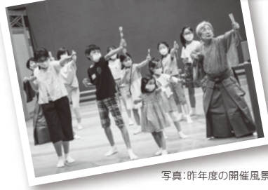
写真：昨年度の開催風景