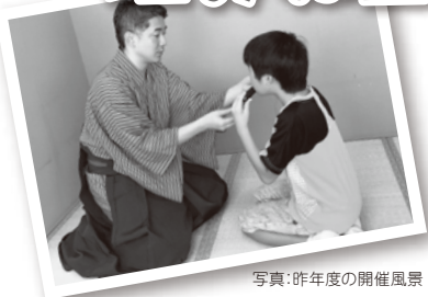
写真：昨年度の開催風景