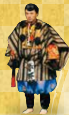
「禰宜山伏」