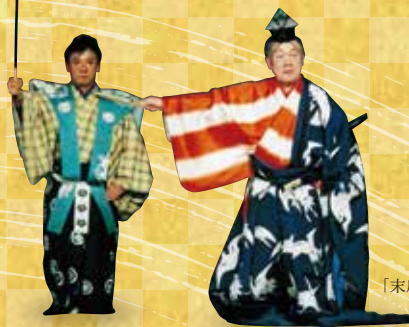
「末広」