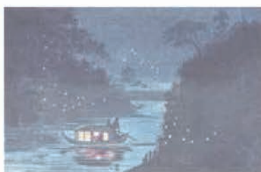
小林清親「御茶水鏡」(前期)