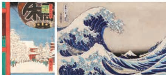
歌川広重 「名所江戸百景 浅草金龍山」 (後期)

後期展では、引き続き斎藤コレクションの中心となる初期から明治期の浮世絵・肉筆画を公開。同コレクションが世界で唯一揃いで所蔵する鈴木春信「風流やつし七小町」のほか、葛飾北斎「富嶽三十六景 神奈川沖浪裏」、歌川広重「名所江戸百景」など傑作を展覧します。