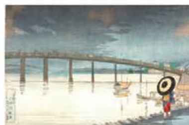
小林清親「東京新大橋雨中図」(前期)

〒210-0007 川崎市川崎区駅前本町12-1 川崎駅前タワー・リパーク3F TEL.044-280-9511 FAX.044-222-8817