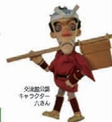
交流館公認 キャラクター 八さん