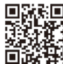
▲公演詳細ページ QRコード

■ お問い合わせ (公財)川崎市文化財団 川崎大師薪能係 TEL 044-272-7366(平日9:00~17:00)