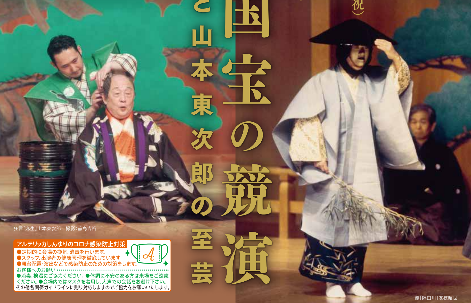
狂言「麻生」山本東次郎