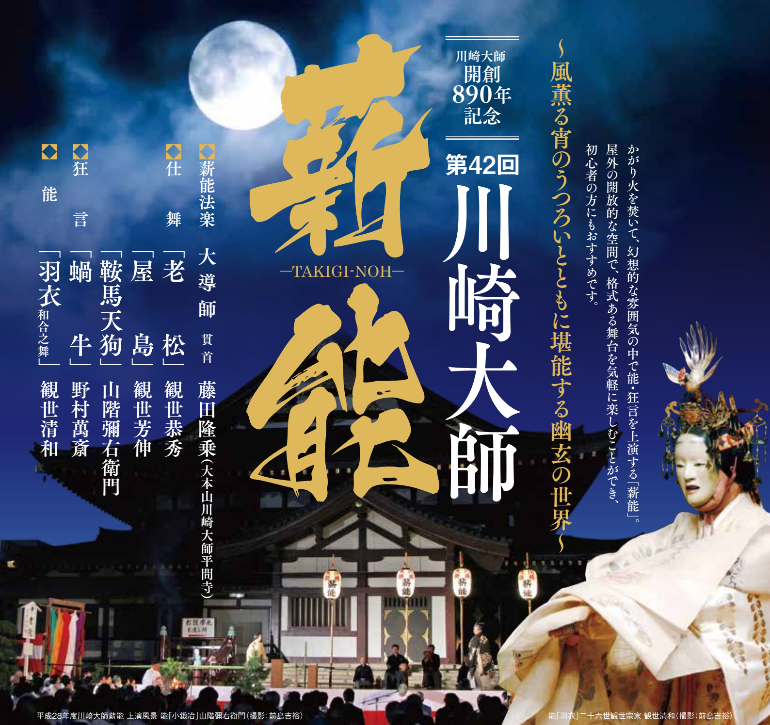
平成28年度川崎大師新能 上演風景 能「小鍛冶」山階彌右衛門