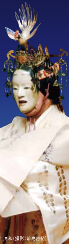
能「羽衣」二十六世観世宗家 観世清和