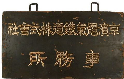
京浜電気鉄道株式会社事務所看板