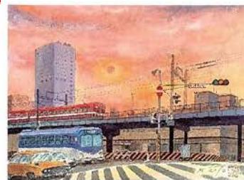
川崎駅前広場（川崎区駅前本町） 1985年 アクリル