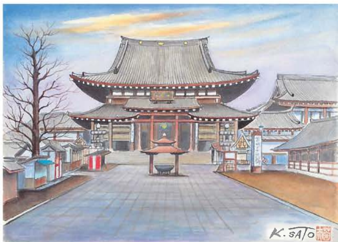
金剛山平間寺（川崎区大師町）1980年 アクリル