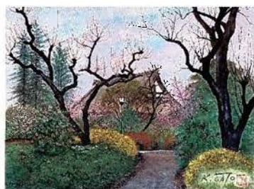
岡上山東光院（麻生区岡上） 1975年 アクリル