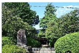
岡上山東光院（麻生区岡上） （写真 イターネット川崎がド）