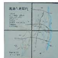
高津八景案内（高津区久本） 1989年10月 タイル画