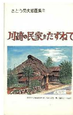
川崎の民家をたずねて 1983年 絵葉書集