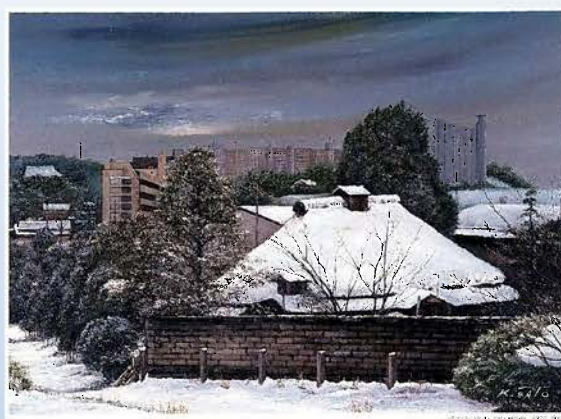
「土橋の屋敷林」(宮前区土橋) 1989 油彩 出典:「川崎百景」(絵:さとう菊夫)